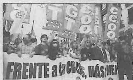
Marcha en defensa de la educación pública, ayer.

Para los sindicatos convocantes (CCOO, UGT, SIEM, CSIF y CSIT), la huelga provocó que cerca del 80% de los profesores de Educación Primaria y Secundaria no acudiera ayer a su puesto de trabajo, cifra que alcanzó el