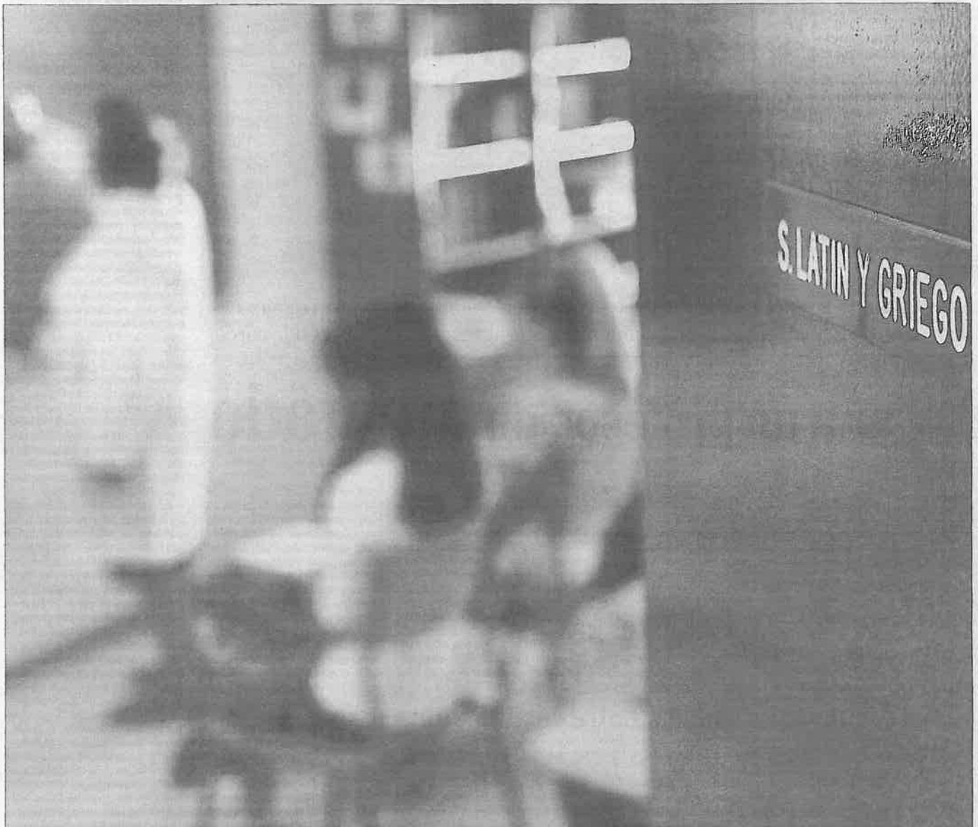
Una profesora, ayer dando clase en el Instituto de Enseñanza Secundaria Joaquín Turina de la calle Guzmán el Bueno de Madrid. / GONZALO ARROYO

● En lo que va de curso, 1.378 maestros de la Enseñanza Pública no universitaria de la Comunidad de Madrid han denunciado agresiones de padres y alumnos, así como presiones para modificar las notas, entre otros aspectos ● La mitad de ellos sufre ansiedad y el 15% ha pedido la baja ● Con respecto al año anterior, las agresiones recibidas por internet –correos electrónicos y redes sociales– se han duplicado /2